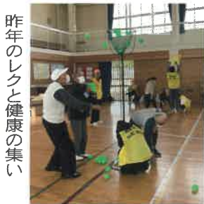
昨年のレクと健康の集い

今年度は、体育振興会と並行して、コミュニティ推進会の中にスポーツ・レク部を新設し、コミュニティの他の部と協力しながら、スポーツ事業を行ってまいります。