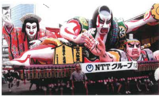
ねぶたの前で記念写真