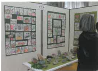
絵手紙の展示様子