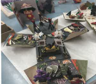
5月に展示された あじさいの会の作品

2階ギャラリー展示希望者を募集しております。連絡先 田尻交流センター 電話(42) 1552