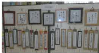
昨年の文化祭の作品展

10月学区文化祭、11月ふるさと再発見ウォーク参加、子ども夢クラブ、体験教室、文化講演会、国際交流事業、田尻幼稚園・小学校総合学習支援、通年の2階ギャラリー展など、皆様のご参加をお待ちしております。(梶田)