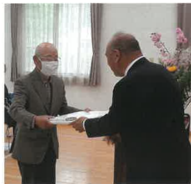
感謝状を受ける下相田第2団地児童公園草刈り隊代表者

本団体は、長年にわたり、有志により公園及び周辺の草刈りを行い、環境美化活動に貢献している。